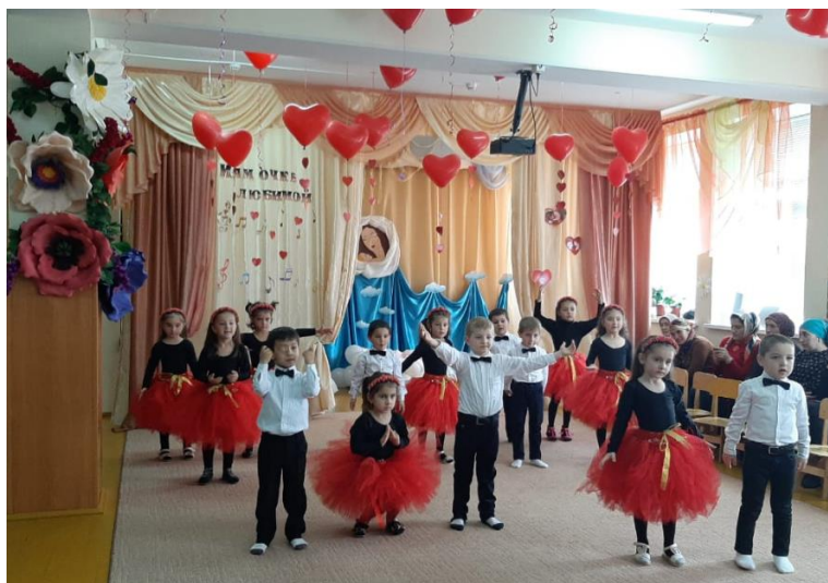
Песня «Это мамин день»