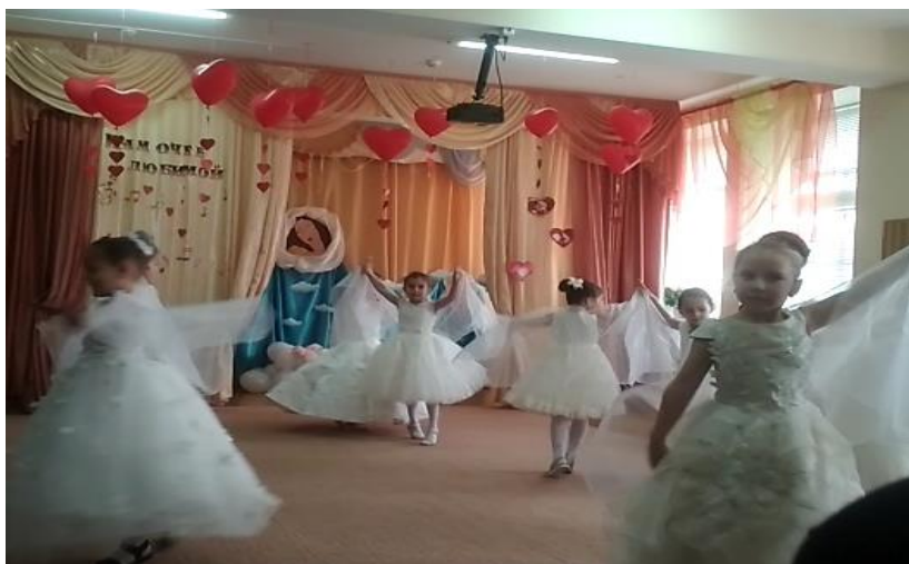
Танец «Мама – Первое слово»