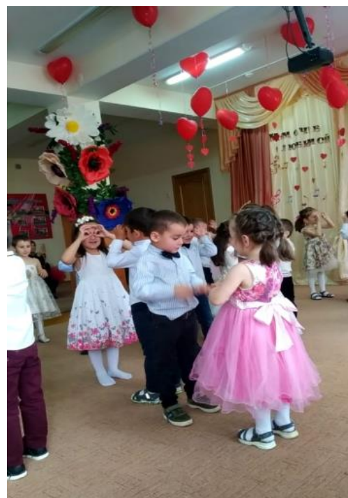
Танец «У меня, у тебя»