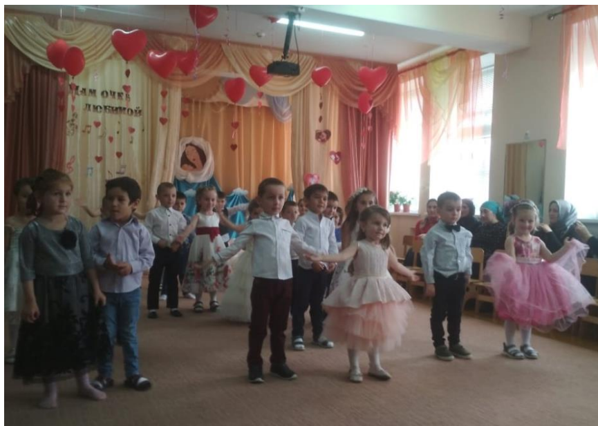
Песня «Очень я мамочку люблю»